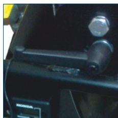
Możliwość zmiany kąta ustawienia wentylatora: -25° - +25°

* poziom ciśnienia akustycznego mierzony z odległości 20m w terenie otwartym, przy pełnych obrotach silnika i przy ciśnieniu akustycznym otoczenia 49dB(A)