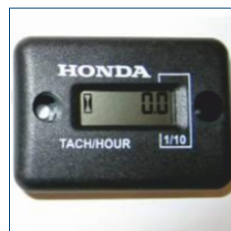
Licznik motogodzin i tachometr do kontroli silnika spalinowego