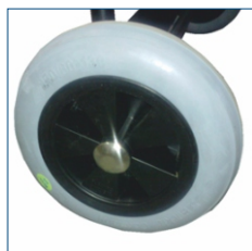
Koła pneumatyczne, pompowane, ułatwiające przemieszczanie wentylatora