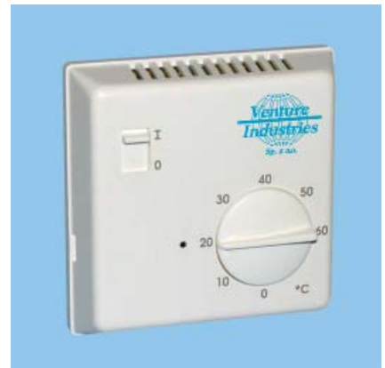
Fot. 11. Czujnik wilgotności HIG-2

Oferowane są również regulatory transformatorowe RMB i RMT, które regulują stopniowo prędkość obrotową przez zmianę podawanego napięcia (w wersji 1-fazowej RMB i 3-fazowej RMT). Do regulacji temperatury stosowane są termostaty, w wersji ściennej TS-2 lub kanałowej TK-1.