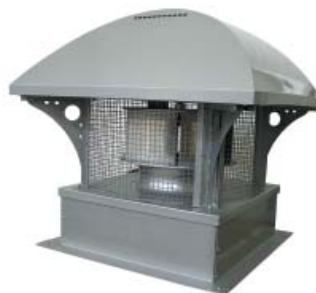
Fot. 7. Wentylator dachowy typu RBH

Dachowe wentylatory promieniowe RBH (7800 ÷ 22 000 m 3 /h) przeznaczone są do wentylacji pomieszczeń o niskim poziomie zanieczyszczenia powietrza. Obudowa wykonana jest z blachy stalowej, natomiast wirnik spawany z blachy aluminiowej; wyważony jest dynamicznie. Wentylatory RBH przystosowane są do montażu na dachach płaskich, po zastosowaniu odpowiednich podstaw dachowych RS mogą być montowane na dachach pochyłych. Na zamówienie wentylatory są dostarczane w dowolnym kolorze palety RAL. Stosowane są w instalacjach wyciągowych supermarketów, hal przemysłowych, warsztatów, magazynów, garaży, parkingów, budynków gospodarczych.