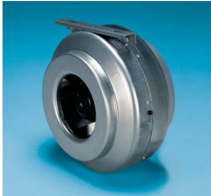
Fot. 4. Wentylator kanałowy typu VENT

Wentylatory osiowe COMPACT – KANAŁOWE (1200 ÷ 43 200 m 3 /h) mają zwartą konstrukcję; przeznaczone do montażu kanałowego w dowolnej pozycji. Wirniki w nich zastosowane są wykonane z odpornego na działanie UV termoplastu wzmocnionego włóknem szklanym lub aluminiowe; są dynamicznie wyważane. Obudowa wentylatorów wykonana jest ze spawanej blachy stalowej. Wentylatory mogą pracować w temperaturze od -40°C do +70°C. Znajdują zastosowanie w wentylacji ogólnej pomieszczeń o cha-