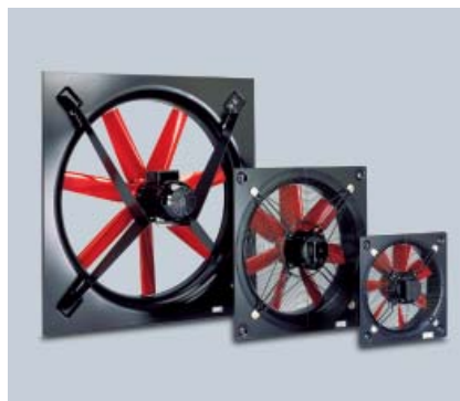
Fot. 1. Wentylator ścienny typu COMPACT

Wentylatory osiowe COMPACT pracują w zakresie wydajności 1200 ÷ 17 500 m 3 /h;