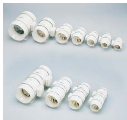
Fot. 3. Wentylator kanałowy typu TD

Wentylatory kanałowe TD pracują w zakresie wydajności 160 ÷ 5500 m 3 /h; są urządzeniami dwubiegowymi, przeznaczonymi do wentylacji pomieszczeń o niskim stopniu zapylenia; przystosowane do pracy w pozycji pionowej i poziomej, w kanałach wentylacyjnych o średnicy 100 ÷ 400 mm.