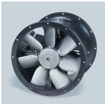
Fot. 5. Wentylator kanałowy typu COMPACT

rakterze użytkowym i przemysłowym, stosowane są również w urządzeniach grzewczych i chłodniczych.