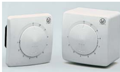
Fot. 8. Regulator REB

nocznego ograniczenia strat ciepła można automatycznie regulować temperaturę oraz wielkość strumienia powietrza wentylacyjnego, stosując czujniki temperatury i regulatory prędkości obrotowej wentylatora. Odpowiednim rozwiązaniem jest zastosowanie jednofazowego regulatora tyrystorowego typu REB, który umożliwia bezstopniową regulację prędkości obrotowej poprzez zmianę podawanego napięcia. Regulator dostępny jest w wersji narynkowej i podtynkowej.