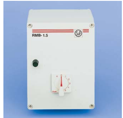
Fot. 9. Regulator RMB

nocznego ograniczenia strat ciepła można automatycznie regulować temperaturę oraz wielkość strumienia powietrza wentylacyjnego, stosując czujniki temperatury i regulatory prędkości obrotowej wentylatora. Odpowiednim rozwiązaniem jest zastosowanie jednofazowego regulatora tyrystorowego typu REB, który umożliwia bezstopniową regulację prędkości obrotowej poprzez zmianę podawanego napięcia. Regulator dostępny jest w wersji narynkowej i podtynkowej.