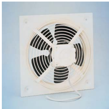
Fot. 2. Wentylator ścienny typu HXM

mają zwartą konstrukcję; przystosowane są do montażu w dowolnej pozycji. Urządzenia te wyposażone są w wirniki z od-